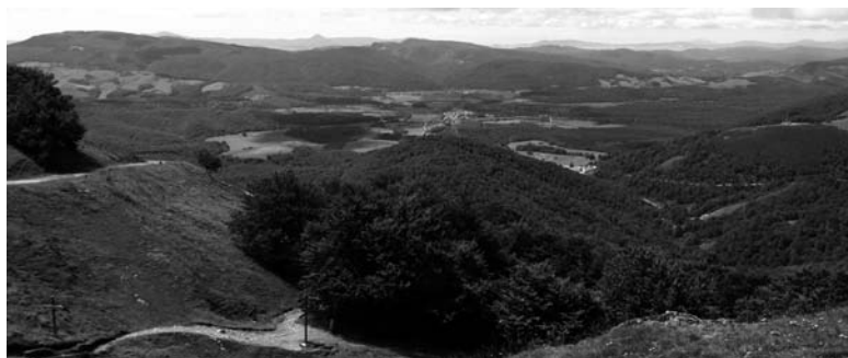
Vista sulla Navarra dal colle di Lepoder