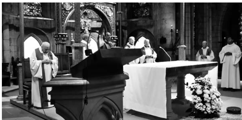
La benedizione del pellegrino