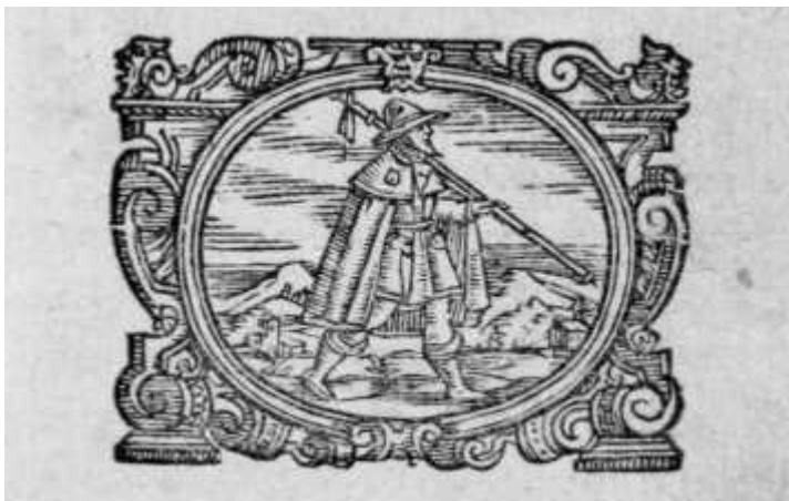
Fig. 12 - Dall'edizione del libro di Laffi , p. 10. In alto la xilografia rappresenta due pellegrini alla fonte, con bordone, cappello a larghe tese, mantella corta. In basso raffigurazione dalla prima pagina di pellegrino con conchiglia di S. Giacomo, mantella lunga, bordone, capello, stivali. Il titolo completo del volume è: “ Viaggio in Ponente à San Giacomo di Galitia e Finisterrae di D. Domenico Laffi bolognese/ Aggiuntovi molte curiosità doppo il suo terzo viaggio à quelle parti.(..) Terza Impressione/ All'illustriss. e Reverendiss. Sig. Co. Carlo Evangelista Grassi, Abbate e Dottore dell'una e l'altra Legge, Prevosto della Metropolitana di San Pietro e Consultore della Santissima Inquisitione di Bologna ”. La data della stampa è del 1681. La dedica al Grassi è del 1676.