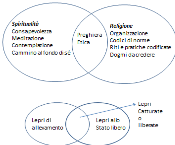
Fig. 1- In alto spiritualità verso religione; in basso una analogia della precedente, di libera interpretazione (2).

“ Cosa centra la fede con il credere in questo o quest’altro? Cosa centra la fede con l’essere umano?” si chiedeva Wilfred Cantwell Smith nel suo “Faith and Belief: Difference between them” ( 1979, 347 pp.; cit. a p. VII). Prima è opportuno precisare i termini. Fede, religiosità , spiritualità e credenza sono usate a volte come sinonimi. Il grafico seguente cerca di render chiaro in che modo saranno utilizzate in questo paragrafo. I confini tra religione e spiritualità sono indefiniti, porosi. Opporre i termini, come in ogni dualismo, allunga la strada, ma non avvicina la soluzione. Chi crede è davvero sicuro di credere e chi non crede è sicuro di non credere? Una persona religiosa può senz’altro essere “spirituale”, nel senso della Fig.1 e viceversa (1).